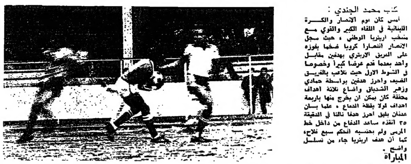
حجة لبنانية والكرة بين بسدي هارس اريتريا